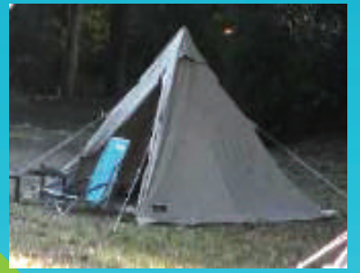
キャンプの断熱方法を 活用する